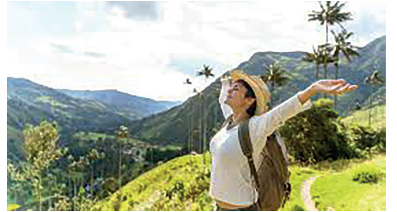
'Ya somos el primer destino turístico de Suramérica': El país de la belleza... presidente Petro. Entre agosto de 2022 y noviembre de 2025 más de 21 millones de visitantes no residentes llegaron a Colombia.