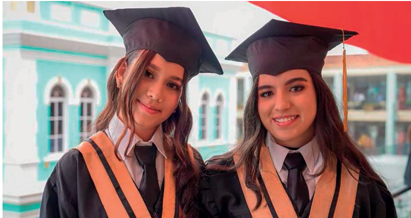
Gracias al programa 'Educación Superior en tu Colegio', más de 300 estudiantes del Valle se graduaron de bachilleres y técnico-profesionales.