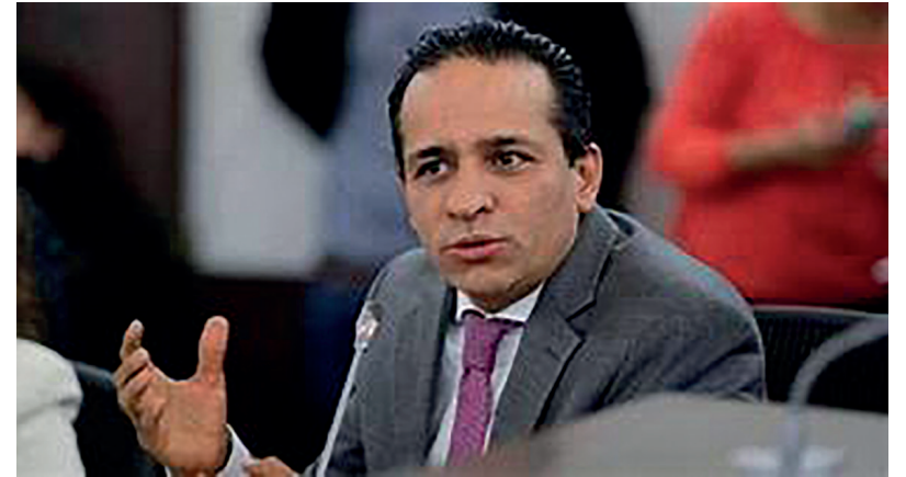
Alexander López regresó al Senado luego de fallo de la Corte Constitucional que le devolvió la curul.