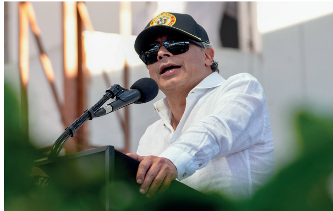
'Si BanRepública baja las tasas de interés se generará más equidad, producción y trabajo': presidente Petro.