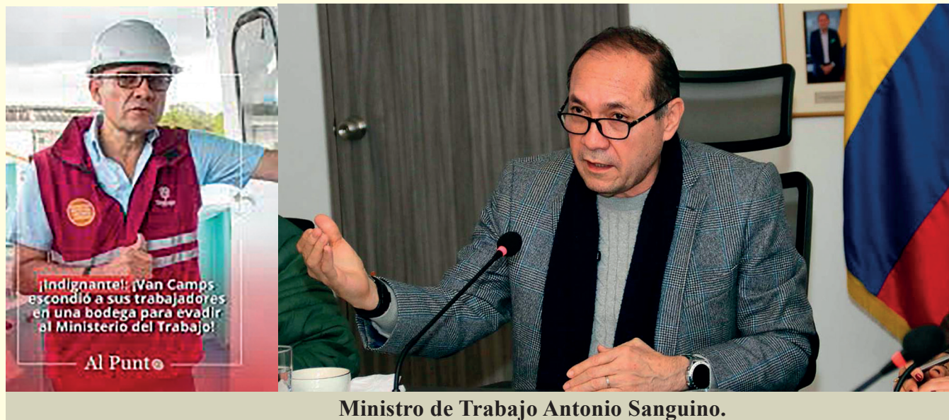
Ministro de Trabajo Antonio Sanguino.