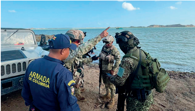
Presidente Petro reportó decomiso de 17 toneladas de cocaína, el mayor en un solo día en la historia del narcotráfico.