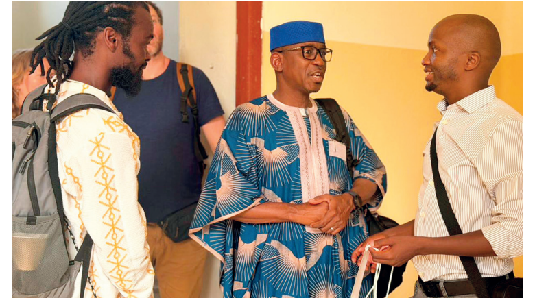
Colombia abre el debate global sobre la Reforma Agraria ante la crisis climática y alimentaria, en la Icarrrd+20