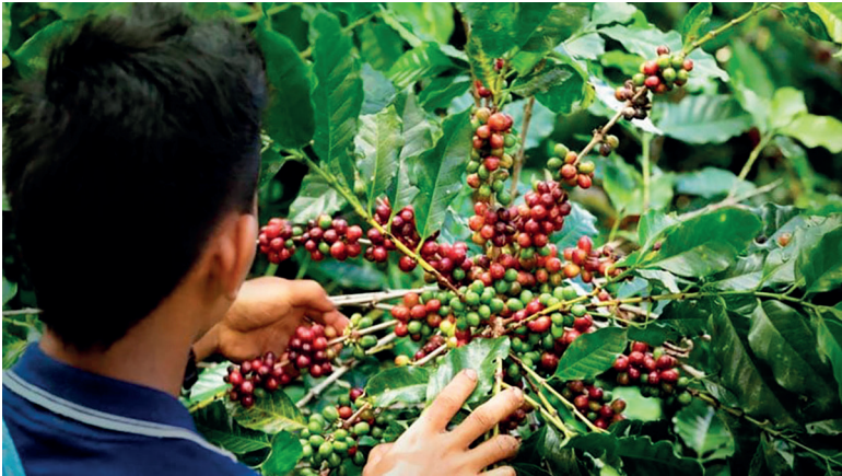
En 2025 se exportaron productos agroindustriales por 3.965 millones de dólares, un crecimiento del 31 % frente a 2024.