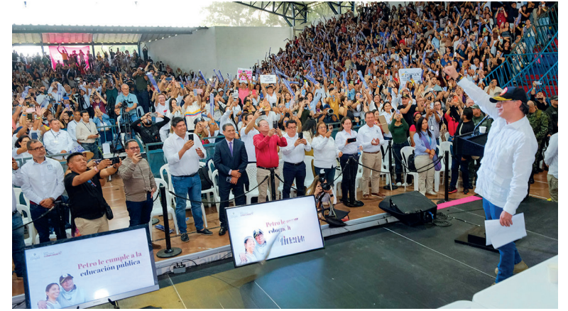
Presidente Petro convoca a América Latina a liderar diálogo entre civilizaciones que detenga la barbarie de la guerra