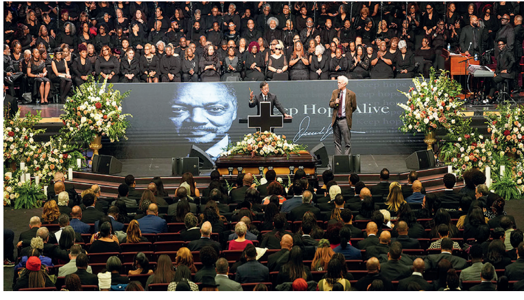
Presidente Gustavo Petro en el funeral del activista Jesse Jackson en Chicago, Estados Unidos, Clinton, Biden y Obama.