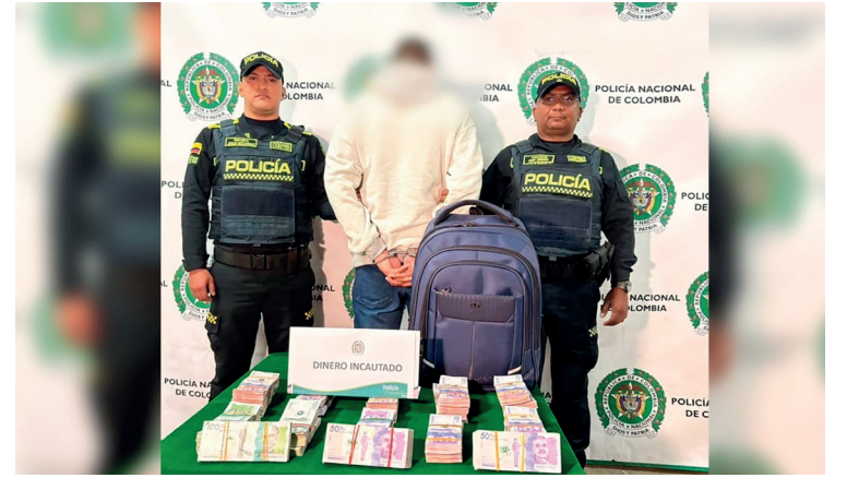
Autoridades han decomisado más de $4.500 millones posiblemente para compra de votos.