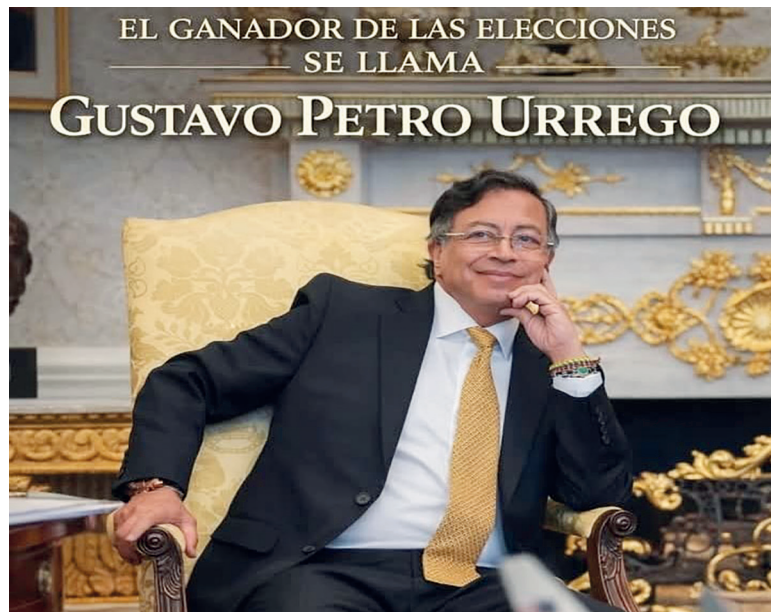
Las elecciones legislativas en Colombia han marcado un punto de inflexión definitivo en la política nacional, consolidando una nueva correlación de fuerzas en el Congreso y despejando el camino hacia la sucesión presidencial. Con el Pacto Histórico erigiéndose como la principal fuerza política del país, los resultados no solo validan la gestión del actual gobierno, sino que otorgan una claridad estratégica sin precedentes a la candidatura de Iván Cepeda.

Iván Cepeda: El Candidato de la Unidad Progresista Más allá de las cifras parlamentarias, la jornada electoral ha servido para decantar las aspiraciones presidenciales dentro del progresismo. Iván Cepeda emerge como la figura central y única con capacidad de aglutinar al voto popular. A pesar de los obstáculos administrativos impuestos por el Consejo Nacional Electoral para impedir su participación