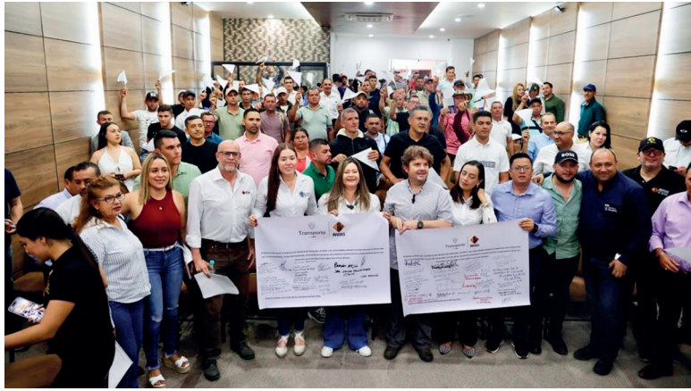
Gobierno impulsa vías ancestrales en el Catatumbo con una inversión de $53.900 millones.