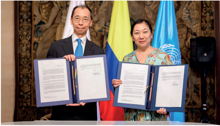
Japón destinó USD 4,2 millones para fortalecer desminado humanitario en Colombia.