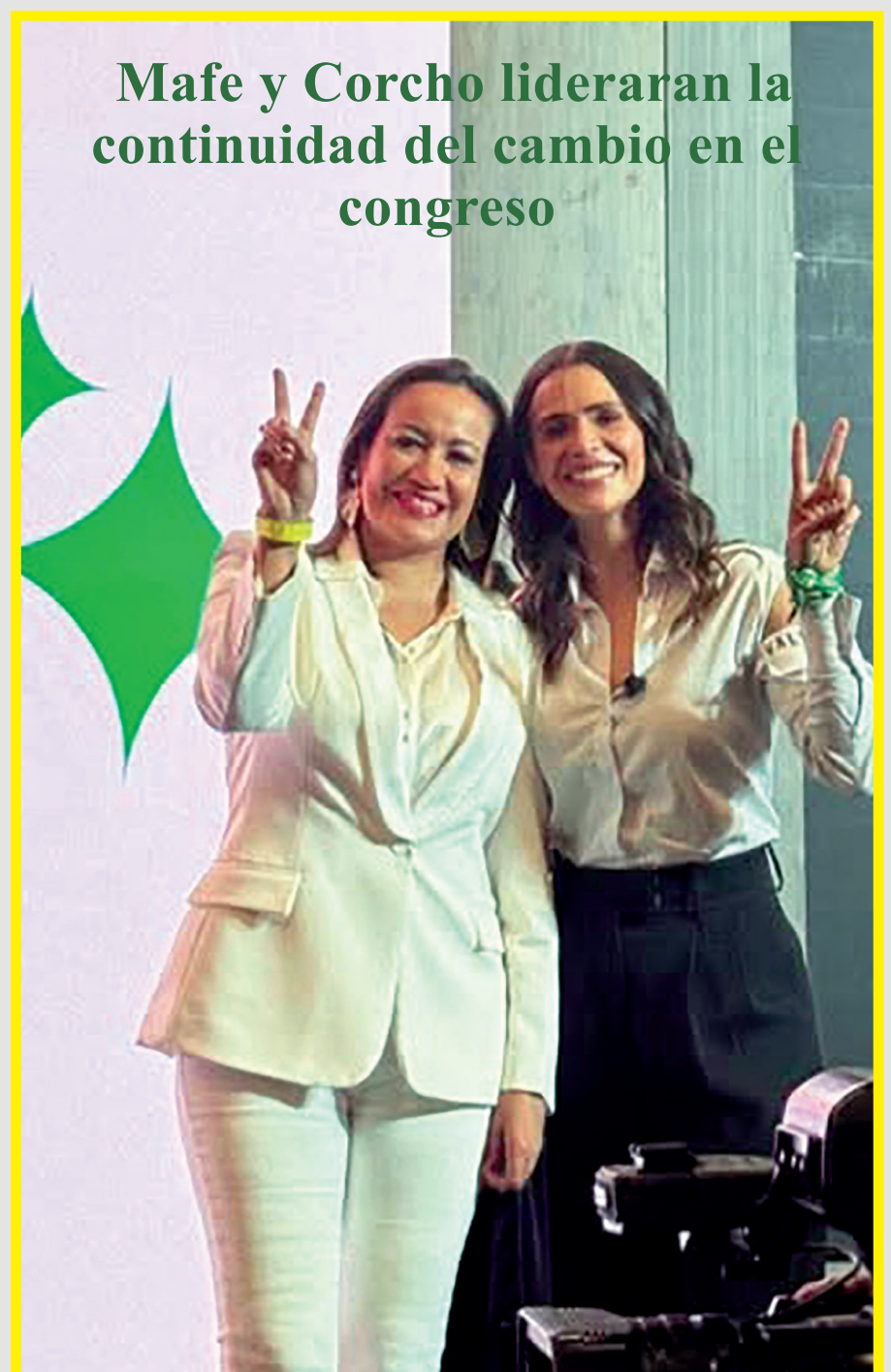
Mafe y Corcho lideraran la continuidad del cambio en el congreso