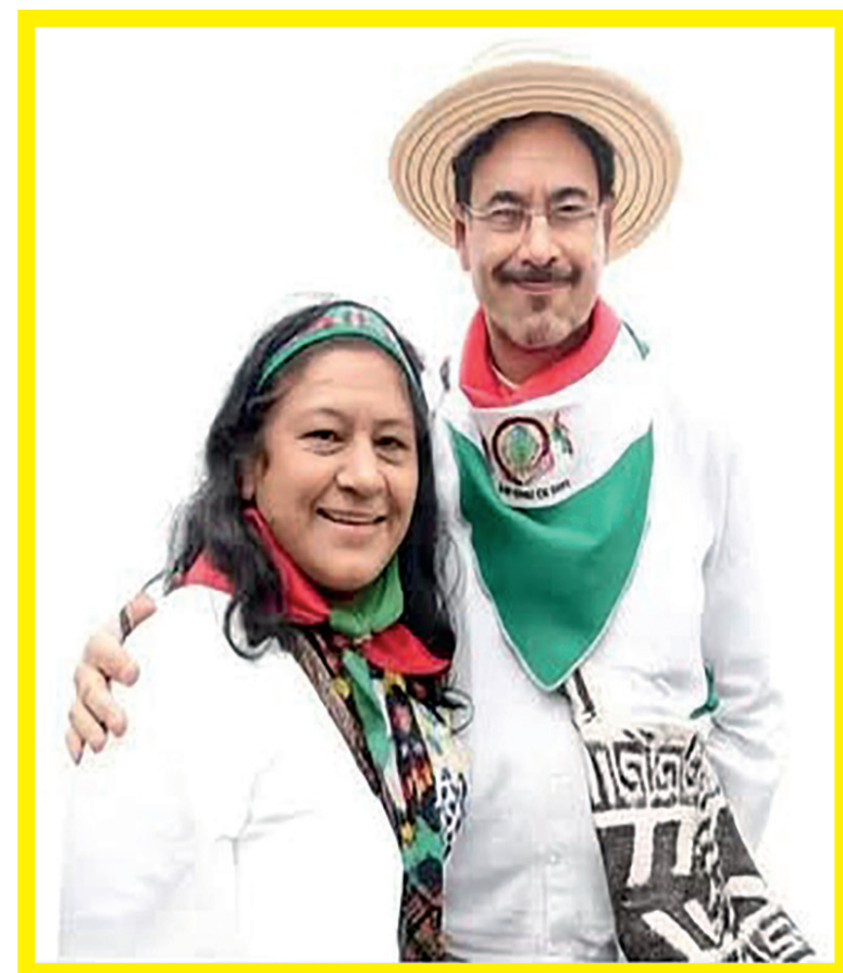
Por primera vez en Colombia una indígena será vicepresidenta. Eso solo pasa en un gobierno progresista. Tenemos que elegir a Iván Cepeda y Aída Quilcué en primera vuelta.

En conclusión, Colombia entra en una etapa de definición. El triunfo en el Capitolio no es solo una victoria numérica, sino el mandato de un pueblo que ha decidido confiar en el camino del cambio social, con Iván Cepeda como el líder encargado de llevar esa bandera hacia el próximo periodo presidencial.