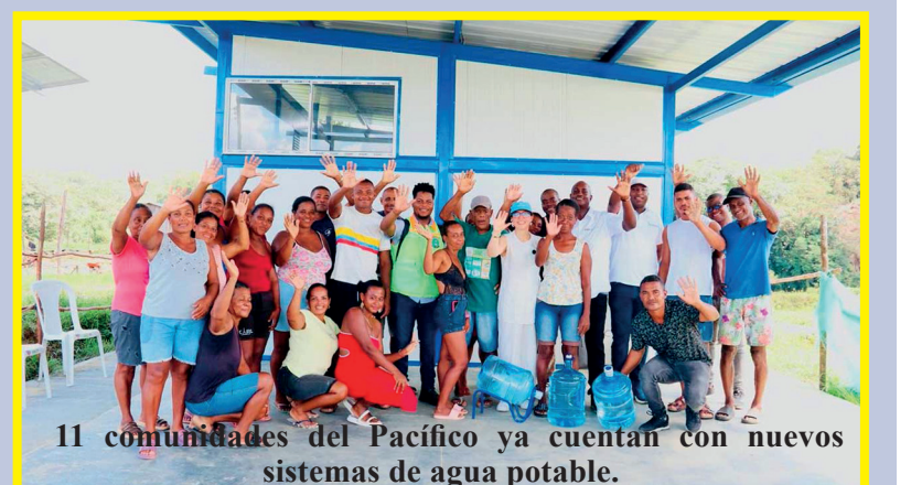
11 comunidades del Pacífico ya cuentan con nuevos sistemas de agua potable.