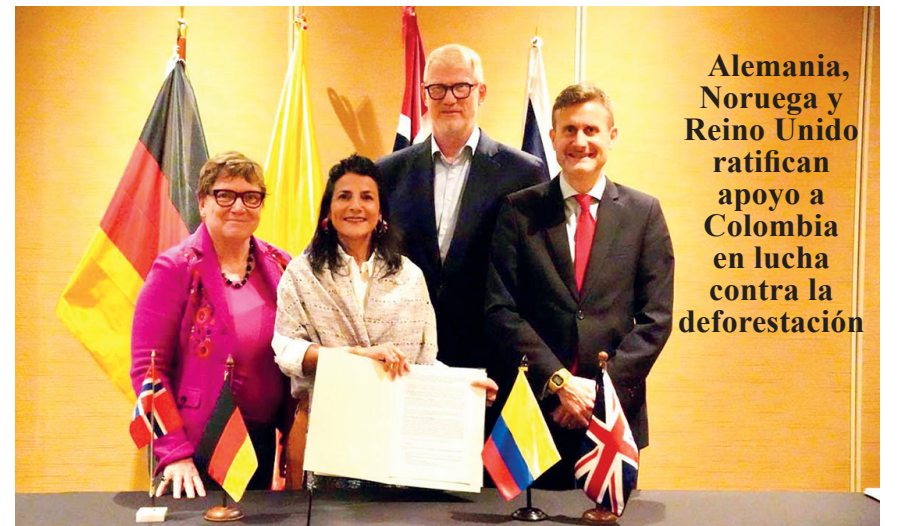
Alemania, Noruega y Reino Unido ratifican apoyo a Colombia en lucha contra la deforestación