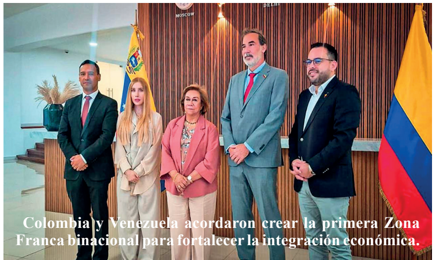
Colombia y Venezuela acordaron crear la primera Zona Franca binacional para fortalecer la integración económica.