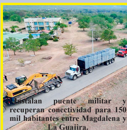
Instalan puente militar y recuperan conectividad para 150 mil habitantes entre Magdalena y La Guajira.