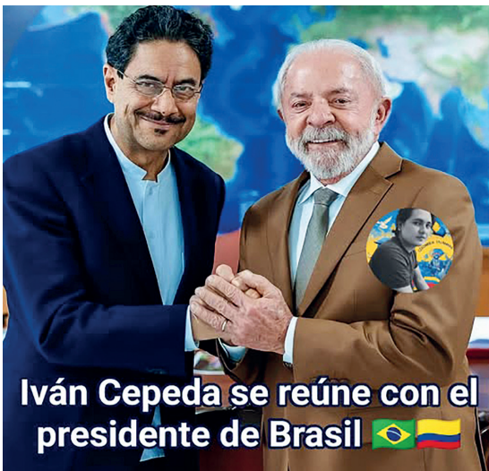
Iván Cepeda se reúne con el presidente de Brasil