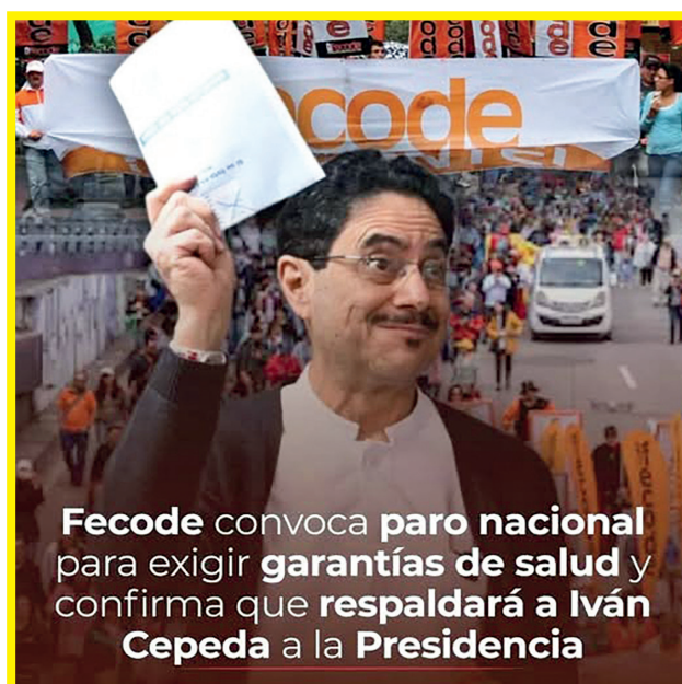
Fecode convoca paro nacional para exigir garantías de salud y confirma que respaldará a Iván Cepeda a la Presidencia