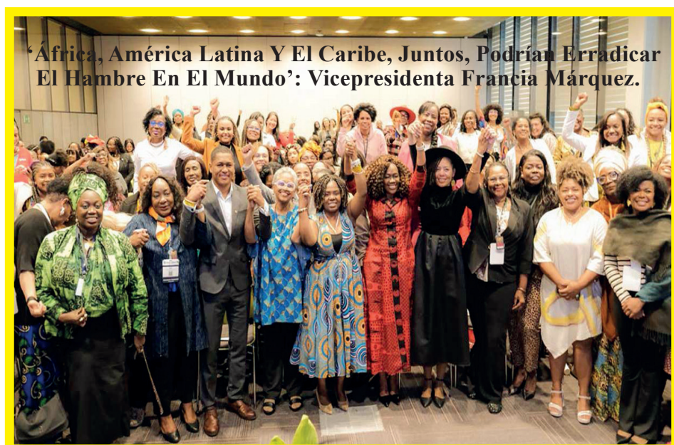
‘África, América Latina Y El Caribe, Juntos, Podrían Erradicar El Hambre En El Mundo’: Vicepresidenta Francia Márquez.

“Nuestra meta es alcanzar una cobertura del 90,8 % en todo el territorio. Para lograrlo, hemos duplicado el presupuesto: pasamos de 1,5 billones en 2022 a 3 billones de pesos este año”, afirmó el directivo.