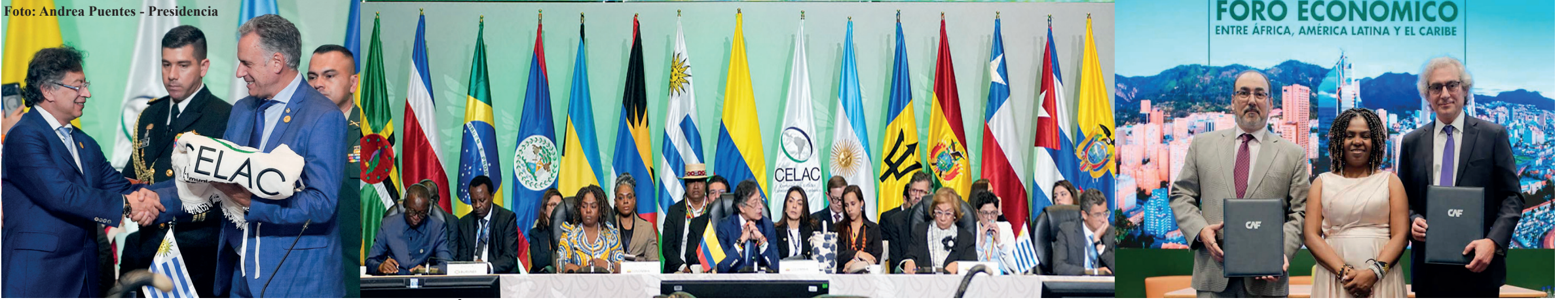
El presidente Gustavo Petro convocó a los países de África, América Latina y el Caribe a buscar su propia identidad como base fundamental para unificar su voz ante el mundo, en momentos en que se desecha el camino del diálogo y se promueve la confrontación de civilizaciones.