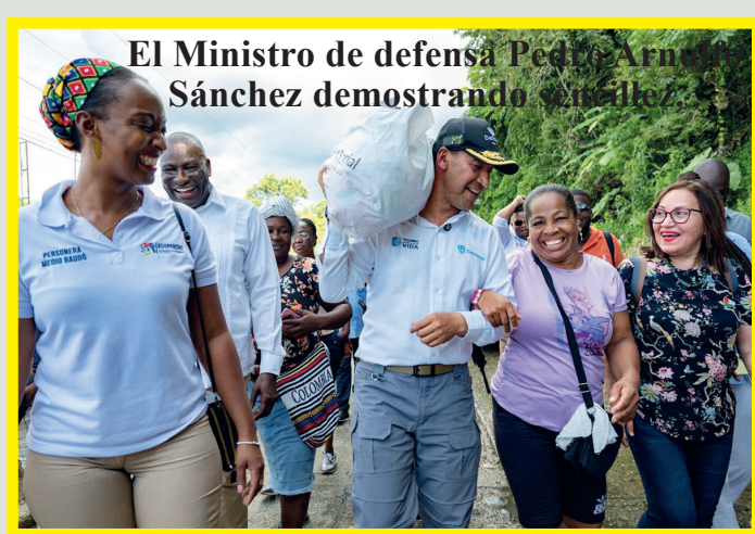
El Ministro de defensa Pedro Sánchez demostrando simpatía