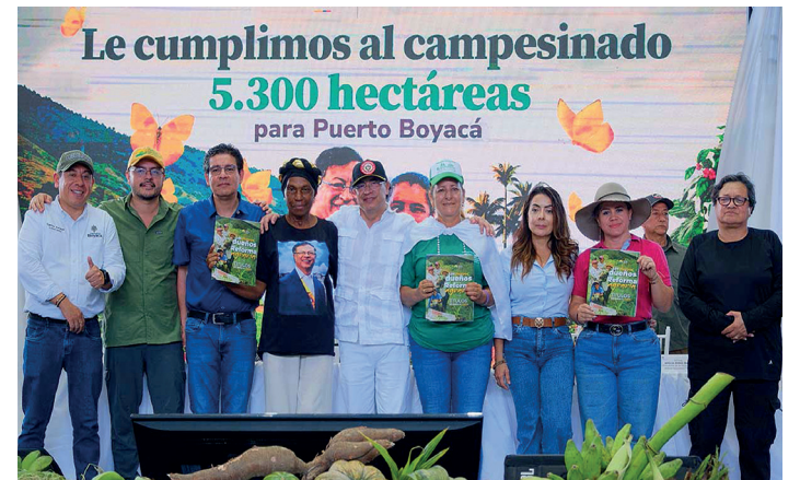
Entrega de 5.300 hectáreas a campesinos en Puerto Boyacá, en el Magdalena Medio.