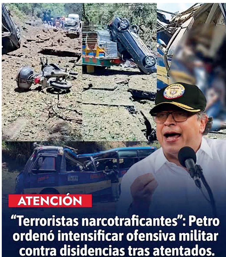
“Terroristas narcotraficantes”: Petro ordenó intensificar ofensiva militar contra disidencias tras atentados.

Para desarticular a estos grupos, especialmente a los frentes alineados con alias Iván Mordisco, el Ejecutivo ha diseñado una estrategia multidimensional que va más allá del combate en el terreno: