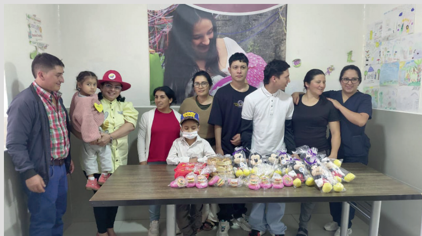
Entrega de regalos durante la jornada, con participación de la Policía Nacional, entidades aliadas, niños y sus familias.

El evento no fue solo una celebración, sino un acto de justicia social dirigido a una población fundamental en la economía digital actual: los hijos e hijas de domiciliarios de plataformas independientes. Estos niños y sus familias disfrutaron de una jornada de recreación integral, donde el juego y la alegría sirvieron como vehículos para transmitir mensajes de cuidado y respeto.