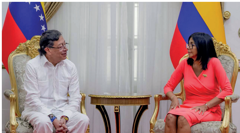
Presidente Petro liderará encuentro en Caracas con Delcy Rodríguez para avanzar en seguridad fronteriza.