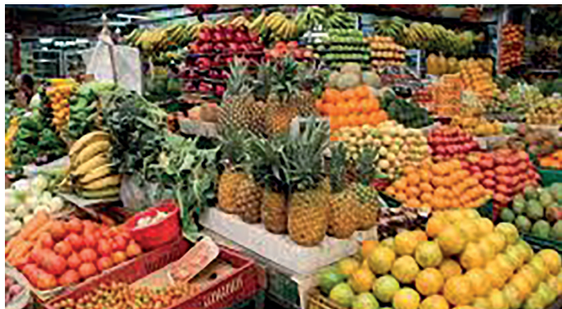
Frutas como maracuyá, granadilla, curuba y gulupa logran posicionarse en más de 30 mercados internacionales.